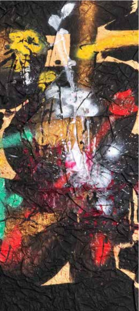
Ladislav Kijno Composition