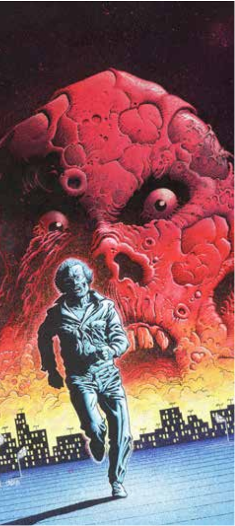
Caza Scènes de la vie de banlieue