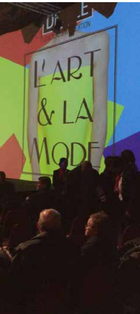
Spectacle vivant L'art et la mode