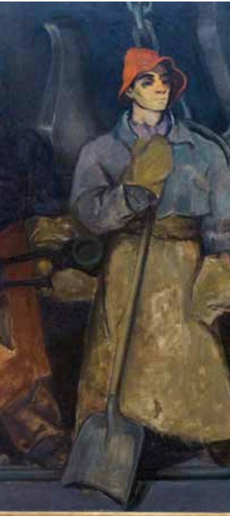
Boris Taslitzky, Les Délégués