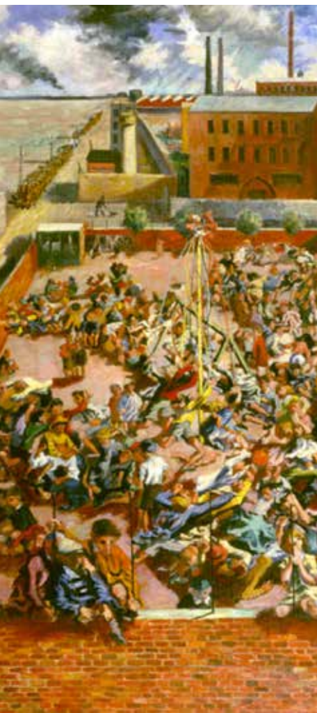
Boris Taslitzky Le jeudi des enfants d'Ivry