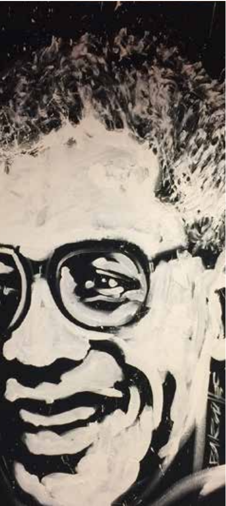
Franck Bourroullec Portrait d'Aimé Césaire