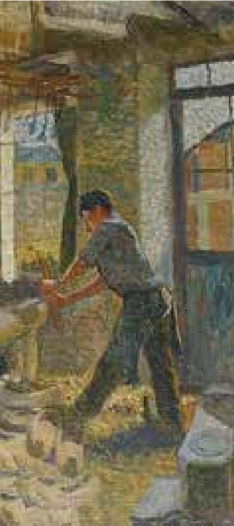
Émile-Gustave Cavallo-Peduzzi Les Sabotiers de Gouvennes