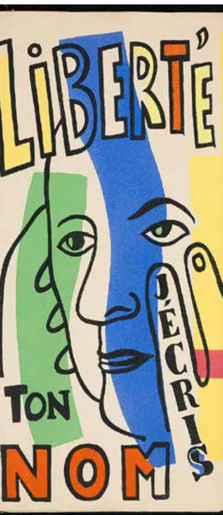
Fernand Léger Liberté j'écris ton nom