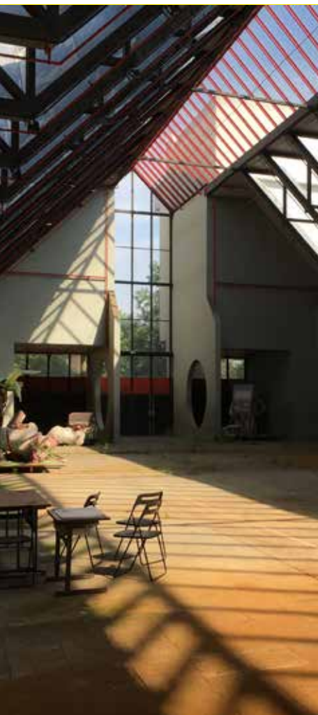
La Halle des Grésillons