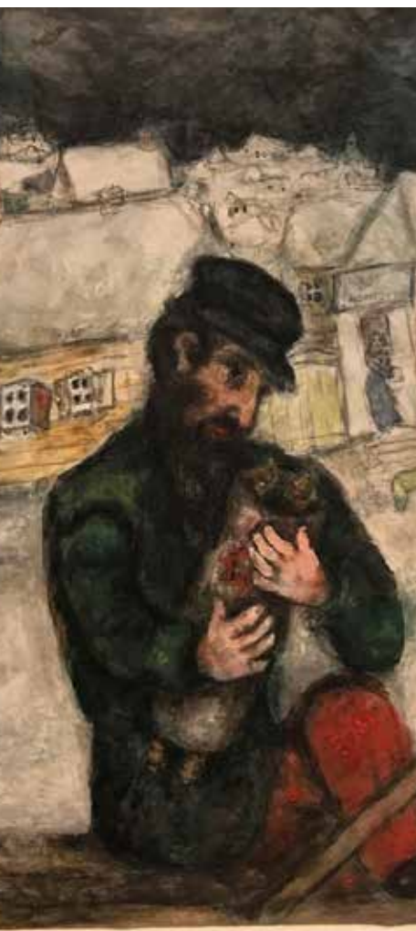
Marc Chagall Juif à la Torah