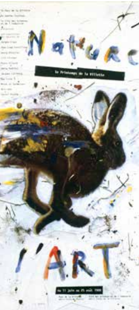
Grapus La nature de l'Art