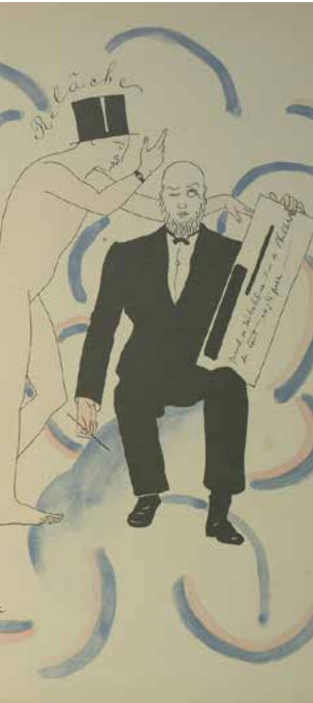
Francis Picabia Dessin pour le Ballet Relâche

Il est en charge du choix des œuvres, de la coordination des différents intervenants, du suivi administratif lié au prêt des œuvres, du suivi et de la validation du catalogue