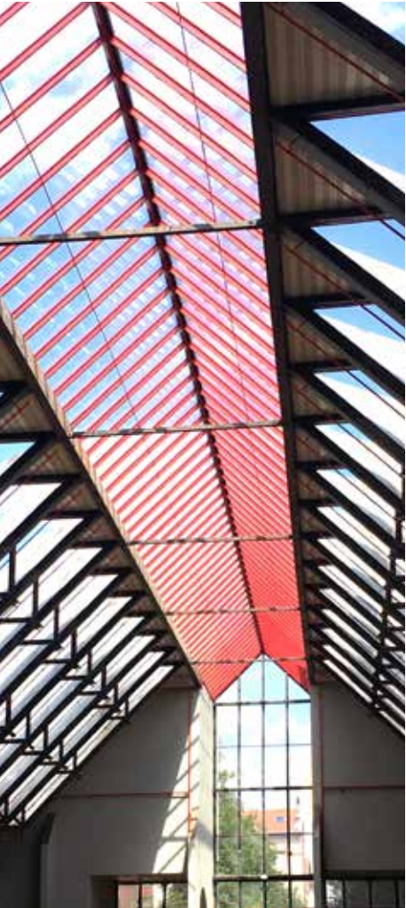
La Halle des Grésillons